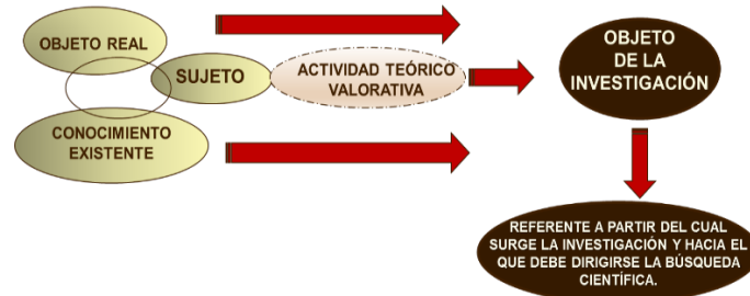
Fig. 2. Determinación del objeto de la investigación

El problema puede verse como la situación propia de un objeto que provoca una necesidad en un sujeto, el cual desarrollará una actividad para transformar la situación mencionada y resolver el problema. Es objetivo por ser una situación presente en el objeto; pero es subjetivo pues para que exista el problema, la situación tiene que generar una necesidad en el sujeto. Se manifiesta externamente en el objeto y es consecuencia del desconocimiento de elementos y relaciones que existen en él. El planteamiento del problema científico es la expresión de los límites del conocimiento científico actual que genera la insatisfacción en el sujeto: la necesidad.