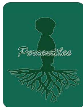
Fig. 1. Interfaz de la aplicación

En las Figura 1, Figura 2 y Figura 3 se pueden observar algunas de las pantallas de la aplicación diseñada.