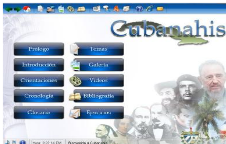
Fig 1. Página de inicio.