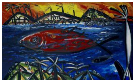
Fig. 2 Ocho rojos y uno negro. Autora: Flora Fong

Otra actividad que se puede realizar es la de recordar detalles, este ejercicio refuerza las habilidades para ejercitar la memoria a corto plazo al tiempo que ayuda al uso del lenguaje almacenado en la memoria a largo plazo. Después de observar durante un tiempo la reproducción de la pintura, los estudiantes deben recordar los detalles, colores y formas utilizados, lo cual puede hacerse en parejas o en grupos pequeños (figura 2). Finalmente esa lámina puede utilizarse para escribir una historia según el punto de vista del estudiante. Para este ejercicio se utilizarán preferentemente paisajes o pinturas que reflejen un hecho histórico.