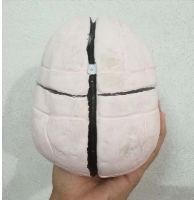
Fig. 3. Vista superior (donde se destaca en color negro y con el número 6, la fisura interhemisférica)