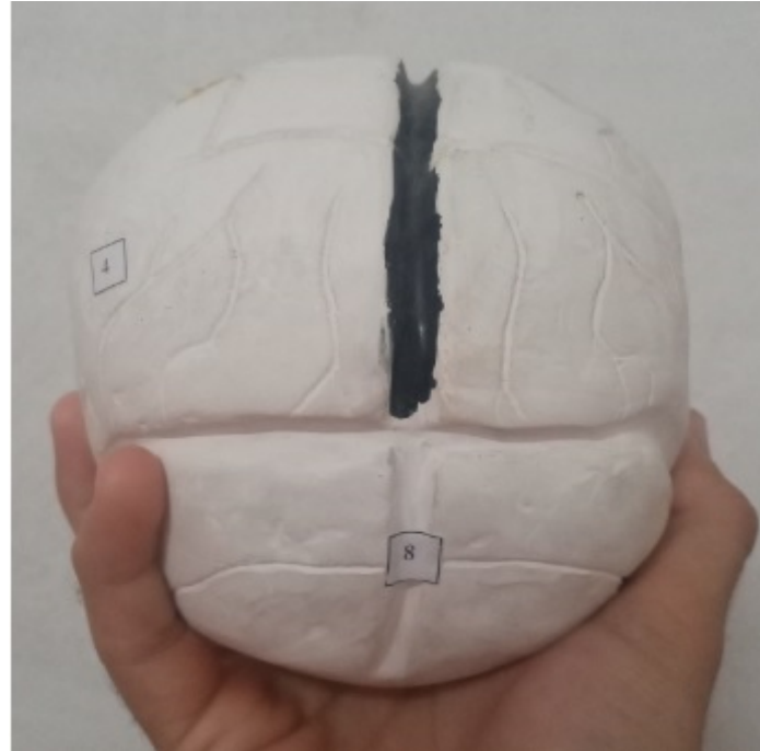
Fig. 4. Vista posterior. Se destacan con los números 4 y 8 los lóbulos parietales y el vermis

La anatomía forma parte de todos los planes de estudios de las carreras de ciencias de la salud y facilita el enriquecimiento del ejercicio profesional de todos los grupos de sanitarios. En la actualidad, por las diversas reformas curriculares, los contenidos de esta materia se han visto disminuidos, situación que en opinión de los autores, puede provocar fisuras en el conocimiento de los estudiantes.