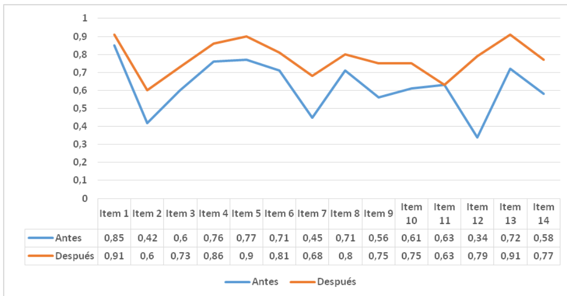
Fig. 2. Índice por cada indicador de calidad de vida de cuidadores primarios antes y después de la implementación del programa de intervención educativa

Fuente: escala de valoración de calidad de vida y satisfacción en familiares cuidadores (ECVS-FC)