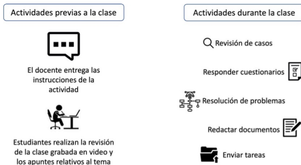
Fig. 1. Estrategia metodológica utilizada en el curso Promoción de la Salud en 2021

Se realizó un estudio cuantitativo, observacional, descriptivo transversal, en estudiantes de Odontología de la Universidad de Antofagasta que participaron el curso semestral de Promoción de la Salud en 2021 (N=60), el cual se llevó a cabo en modalidad remota de emergencia como consecuencia de la pandemia por COVID-19. En este curso se implementó la metodología aula invertida en 8 sesiones, según muestra la Figura 1.